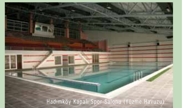
Hadımköy Kapalı Spor Salonu (Yüzme Havuzu)