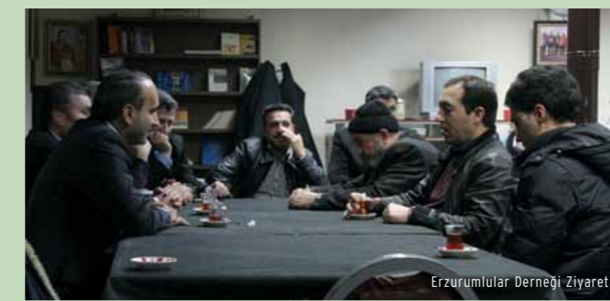
Erzurumlular Derneği Ziyareti