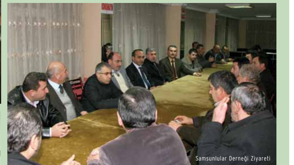
Samsunlular Derneği Ziyareti

Dernek çalışmaları ve Arnavutköy Belediyesi hizmetleri hakkında sivil toplum kuruluşlarının fikirlerinin alındığı ziyaret ve toplantılar dernek yöneticileri tarafından memnuniyetle karşılandı.