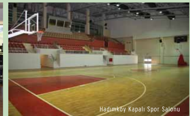
Hadımköy Kapalı Spor Salonu