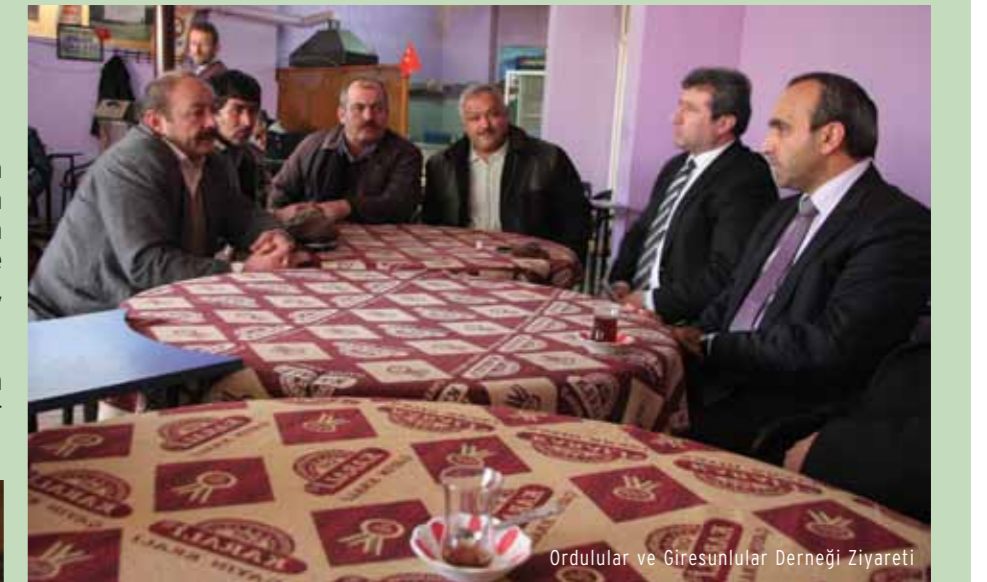
Ordulular ve Giresunlular Derneği Ziyareti