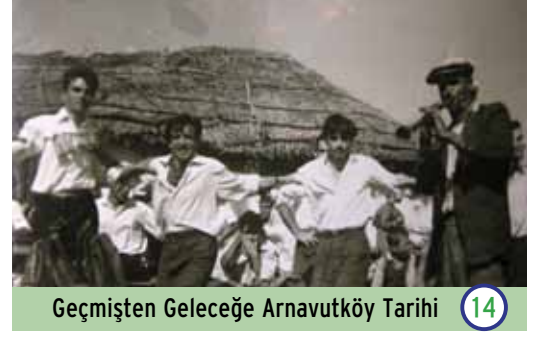
Geçmişten Geleceğe Arnavutköy Tarihi 14