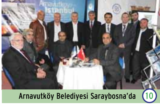
Arnavutköy Belediyesi Saraybosna'da 10