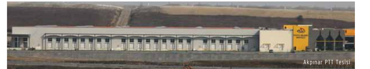
Akpınar PTT Tesisi

Dünya çapında başarılı örnekler incelenerek yola çıkılan "Akpınar Sanayi Bölgesi"nde çalışanların gereksinimleri ön planda tutuluyor. Vardiya bittiğinde terk edilip gidilmeyen, çalışanların aileleriyle birlikte tüm sosyal ihtiyaçlarının karşılandığı bölgede parklar, sinema, bankalar, alışveriş merkezi ve kafeteryaların inşaatı sürüyor. Sanayi bölgesinin tam ortasında yer alan bin kişilik modern camii de ibadetlerini gerçekleştirmek isteyen çalışanların hizmetine sunuluyor.