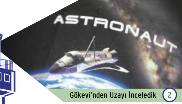
Gökevi'nden Uzayı İnceledik 2