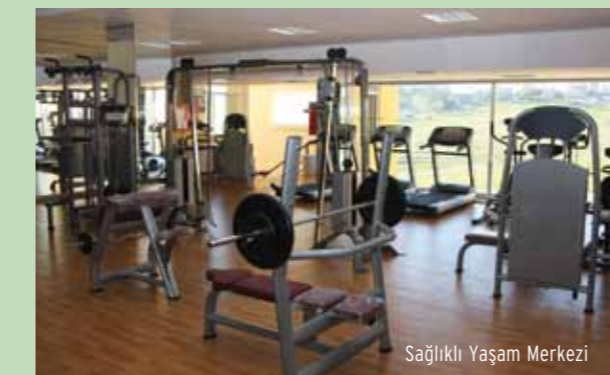
Sağlıklı Yaşam Merkezi

ve kilo verme gibi sağlıklı yaşamı seçen herkes salona davet ediliyor. Düşük bir ücretlendirme ile belli periyotlarla yapılan programlar alanında uzman eğitmenler tarafından düzenleniyor. Her yaşta ayrı program düzenleyen spor eğitmenleri, isteyen herkesin kendine uygun zamanlarda spor yapabileceğini belirtiyor.