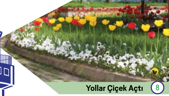
Yollar Çiçek Açtı 8