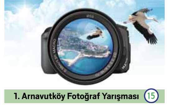
1. Arnavutköy Fotoğraf Yarışması 15