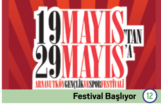
Festival Başlıyor 12