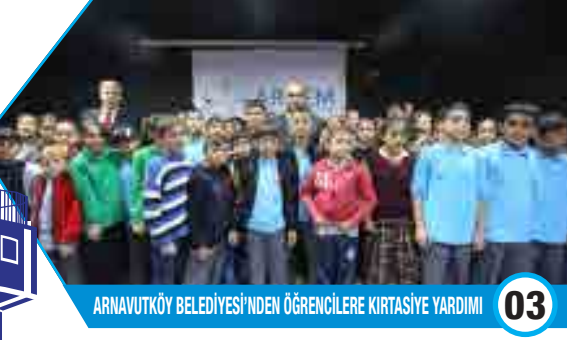
ARNAVUTKÖY BELEDİYESİ'NDEN ÖĞRENCİLERE KIRTASIYE YARDIMI 03