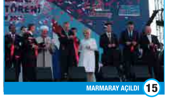
MARMARAY AÇILDI 15